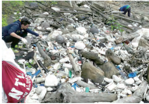
▲同心合意清除垃圾