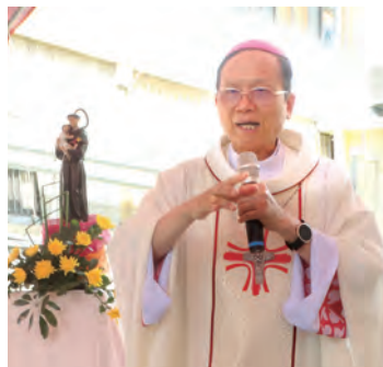
▲安道主保彌撒，由鍾安住主教主禮。

基金會特別安排遊覽車接大埔長輩們下山，兩個小時多的車程，沒人喊累，一看到鍾主教，如同看到熟悉的老朋友開心不已。