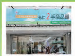
忠孝店 近捷運忠孝復興站

龍山啟能中心·育仁啟能中心 育仁兒童發展中心·聖心兒童發展中心 大同中山早療資源中心·萬大社區家園