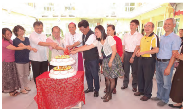
▲安道基金會慶祝主保日，歡慶深耕有成。