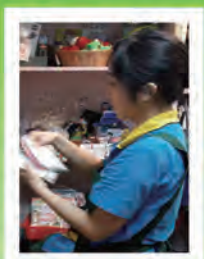
大直店 捷運大直站內 近3號出口