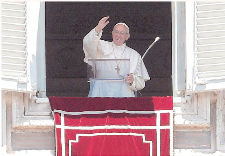
▲教宗方濟各6月11日帶領三鐘經，與聖伯多祿廣場上的朝聖人士熱情揮手致意。