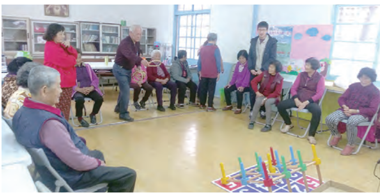
▲賓果投擲課程，益智又有趣。