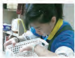
古亭店 捷運古亭站內 近9號出口