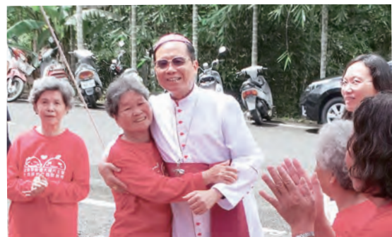
▲鍾安住主教關懷老人未來，高瞻遠矚，落實照顧。