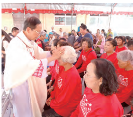
▲鍾安住主教為長者降福，會場洋溢溫馨。