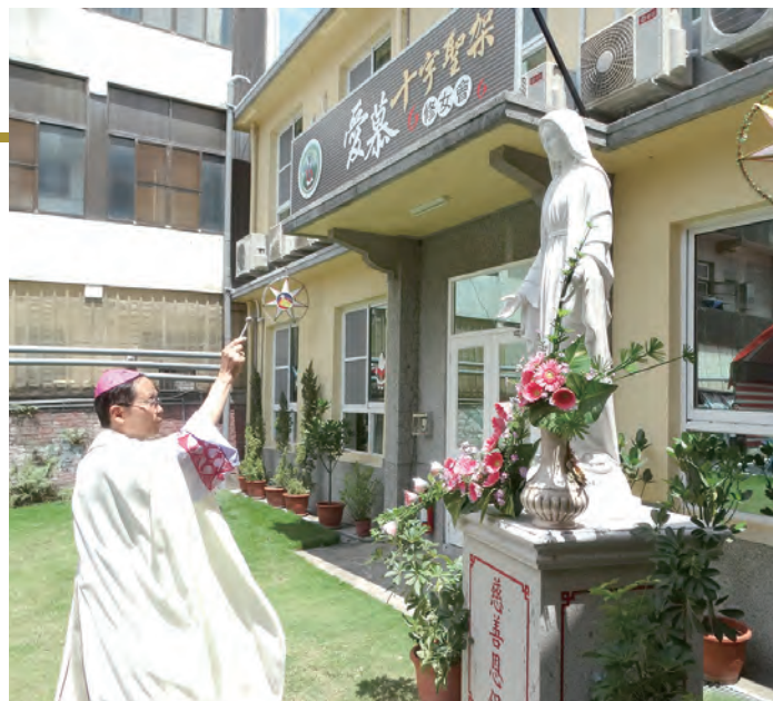
▲安納家園 ▲鍾安住主教向無染原罪聖母像行祝福禮，祈求聖母媽媽轉禱護祐安道。