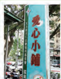
國興店 近青年公園