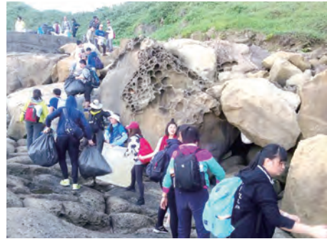
▲將垃圾有效率的運送出去

在這一天的開始，我首先被風的聲音打動。在我們的靜默中、在懸崖頂上，我清楚地聽見風的聲音。當我們被邀請選擇一個感官來聚焦感受時，我自然而然地選擇了聽覺。可能這是因為我每天都被強迫聽著距離我的窗戶20公尺範圍內的建築工作聲：敲打、挖掘、鑽孔……，連續幾個月下來，這真的干擾了我。此時，聆聽海岸的聲音：風在樹梢間移動、海濤衝擊沿岸……，當我對此越充滿感謝，同時也越感到自己正在接近某種美麗。